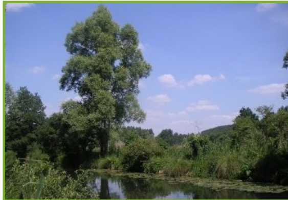
Schéma régional de cohérence écologique d'Ile-de-France adopté